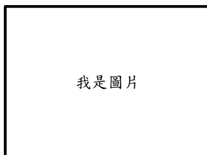
圖 2-2 ○○○12 字型、置於圖下方、置中